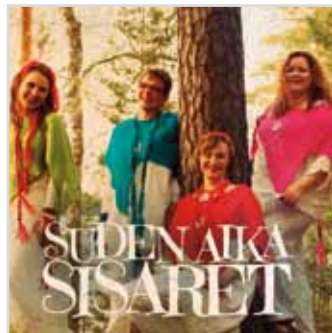
SUDEN AIKA Sisaret

Ernie Watts Quartett Home Light CD, 09 Titel, 68:00 Minuten Bestellnr.: 35103672 17.- €