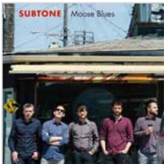
SUBTONE Moose Blues